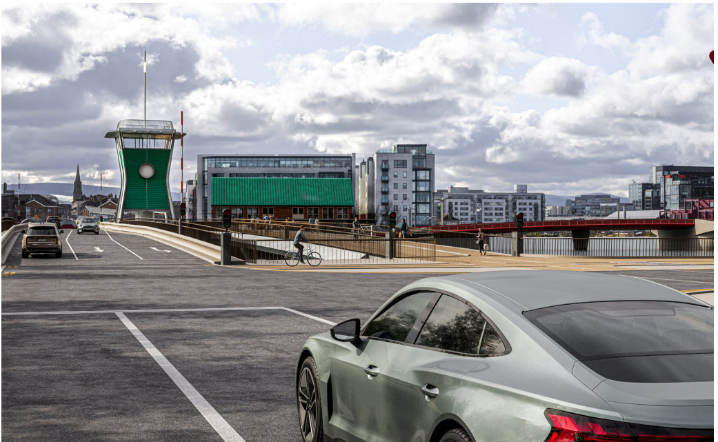
Radharc den Leathnú ar Dhroichead Thomáis Uí Chléirigh agus Droichead an Phointe leis an túr rialúcháin molta ó Ché an Phoirt Thuaidh