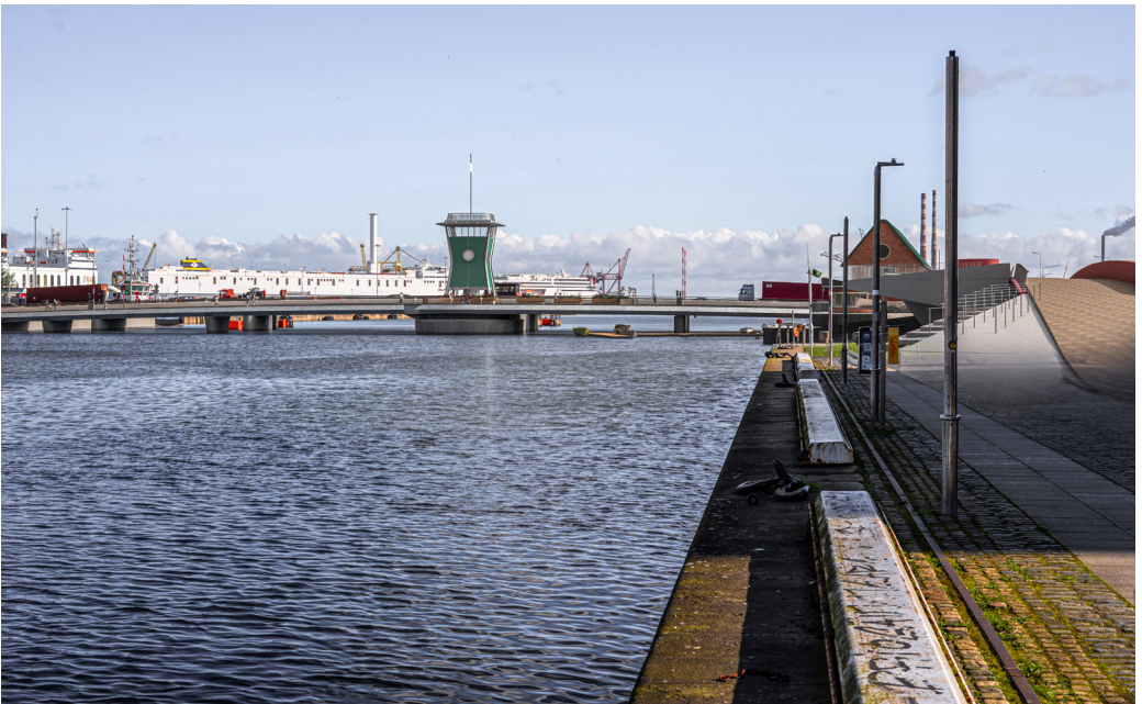
Radharc de Dhroichead an Phoinge agus den túr rialúcháin ó Ché Sir John Rogerson