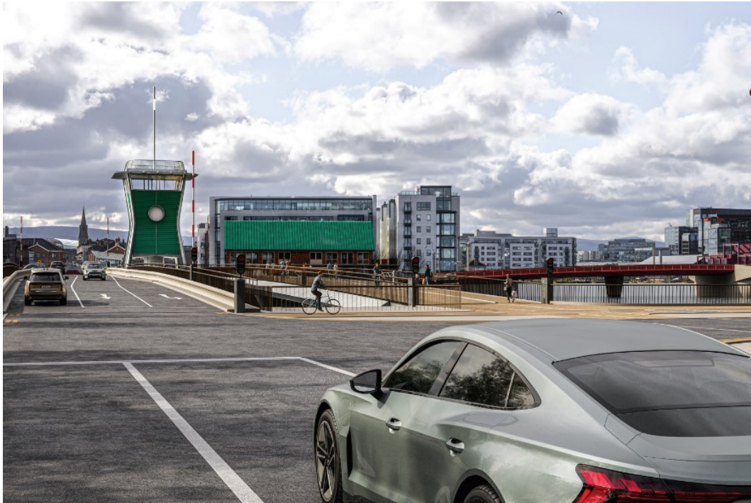
Fótamontáís 1 – Radharc den Leathnú ar Dhroichead Thomáis Uí Chléirigh agus Droichead an Phointe do Choisithe agus Rothaithe leis an túr rialúcháin a mholtar ó Ché an Phoirt Thuaidh