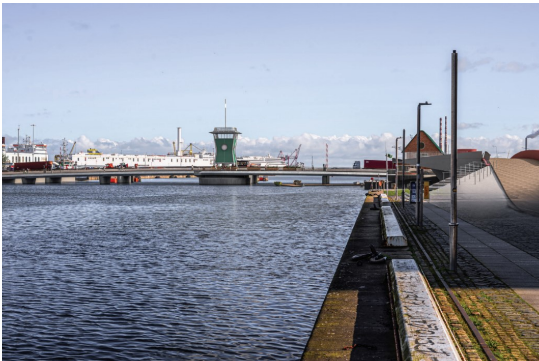
Fótamontáís 2 – Radharc de Dhroichead an Phointe agus den túr rialúcháin ó Ché Sir John Rogerson